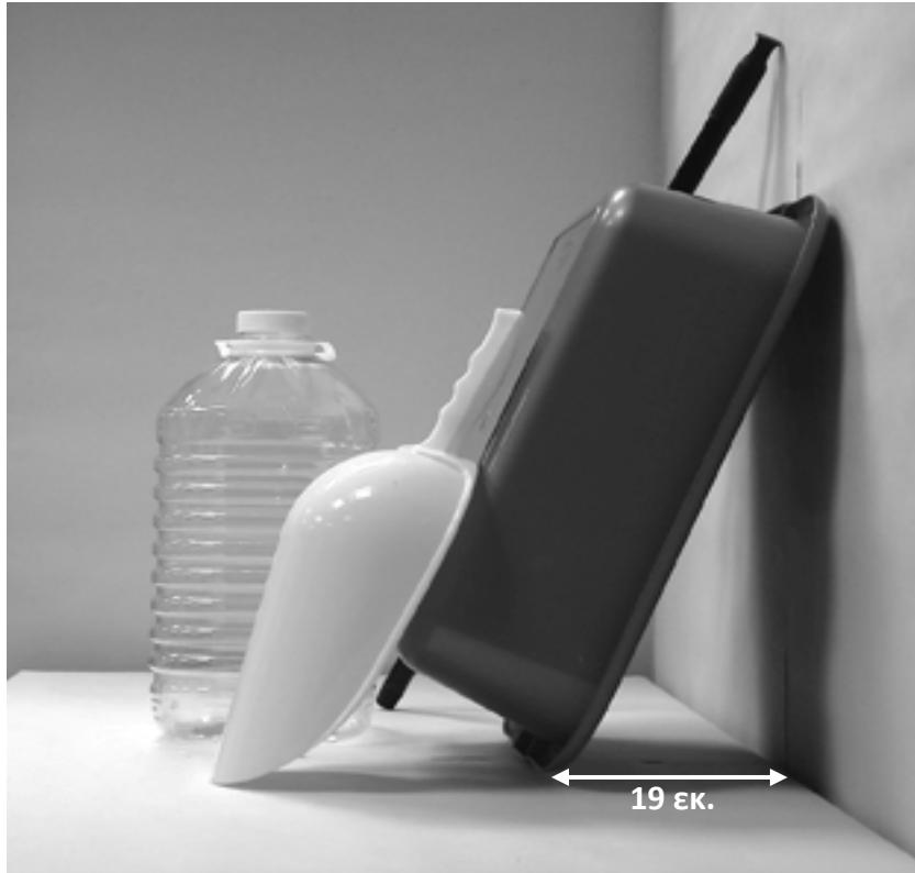
τρίτη φωτογραφία: πλάγια όψη