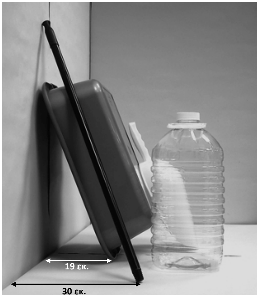
τέταρτη φωτογραφία: πλάγια όψη